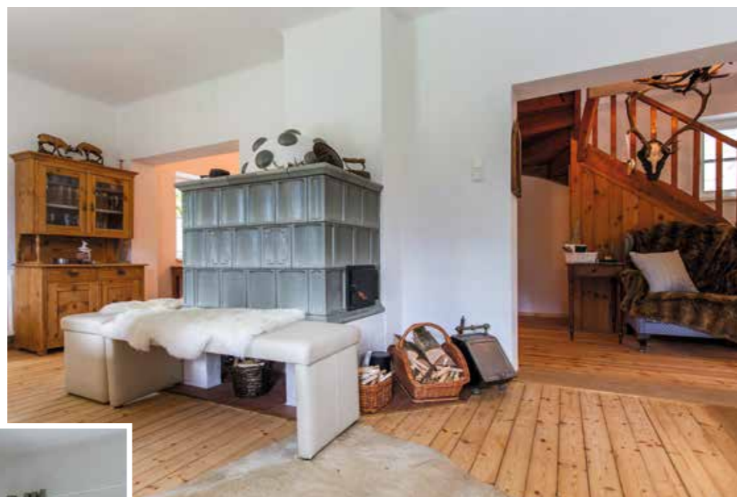
HEIMELIG. Der alte Kachelofen strahlt Wärme und Gemütlichkeit in die großzügige Diele neben der modernen Küche.