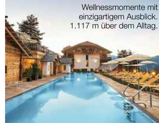
Wellnessmomente mit einzigartigem Ausblick. 1.117 m über dem Alltag.

INFO Nina Behrendt & Andy Tichy www.holidaysun.at