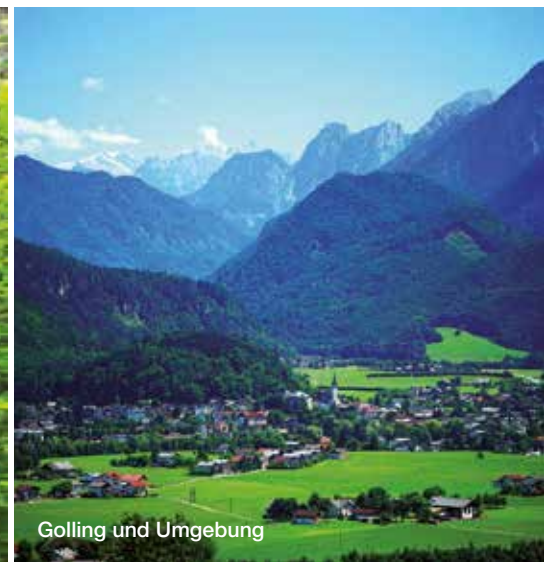
Golling und Umgebung